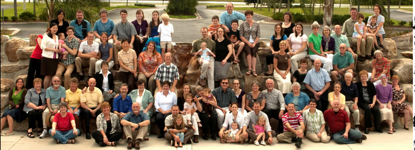
Equip 6, Orientierungswochen at Wycliffe USA Headquater in Orlando, Florida (April 2010)